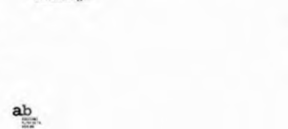
Un'antologia da non perdere

25 anni di racconti intorno alla provincia meno italiana d'Italia Un'antologia