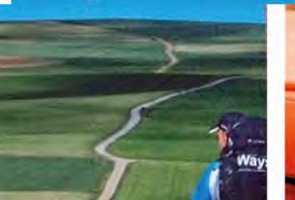
Il libro del campione di orienteering

tino e in Alto Adige in un volume ricco anche di documentazione iconografica (Curcu & Genovese, 16 euro). "Arte trentina del XX secolo" di Maurizio Scudiero (edizioni Uct, 50 €) è invece una ricognizione per decenni tra artisti, correnti e movimenti: un panorama che merita di essere con conosciuto, al di là di Fortunato Depero superstar, per capirci. Per la narrativa a chilometro zero due titoli al di fuori delle convenicole. Letture aspre, appaganti. Il trentino Giacomo Sartori firma "Rogo" (CartaCanta, 14 €), tre storie di donne attraverso i secoli. Nella impeccabile traduzione di Stefano Zangrando le edizioni Alfabeta propongono invece "Il delta" (14 €) di Kurt Lanthaler , uno dei maggiori scrittori altoatesini di lingua tedesca. Passioni, dolori, malinconie lungo il Po e anco-