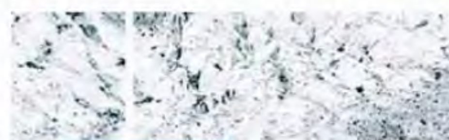
Toni Coleselli in cura al