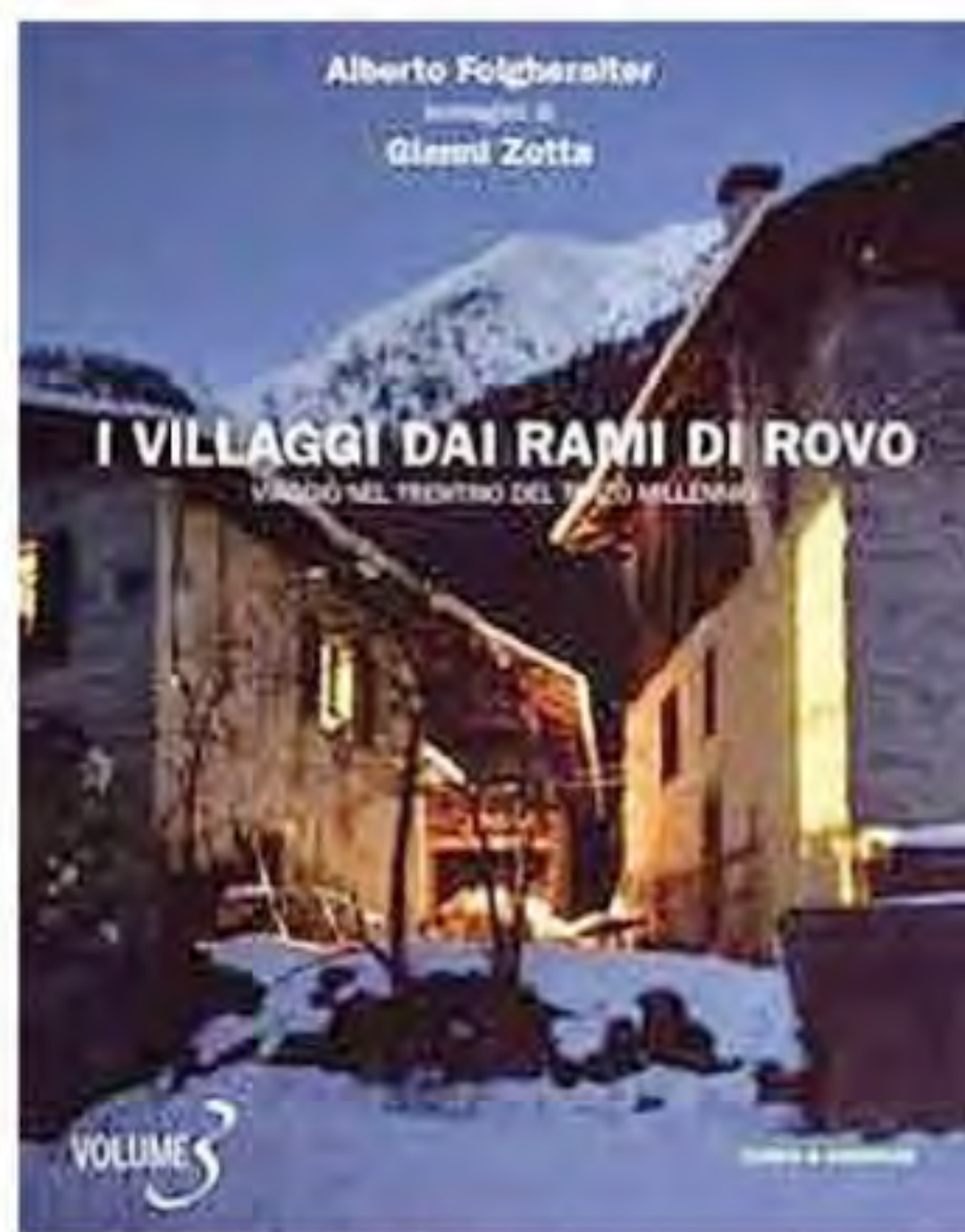
Viaggio nei paesi del Trentino